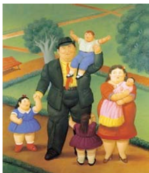
Gravidanza - Adulto

In questo capitolo sono trattati temi che vanno dalla pre gravidanza fino all'età adulta.