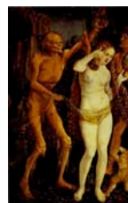
Hans Baldung Grien 1509