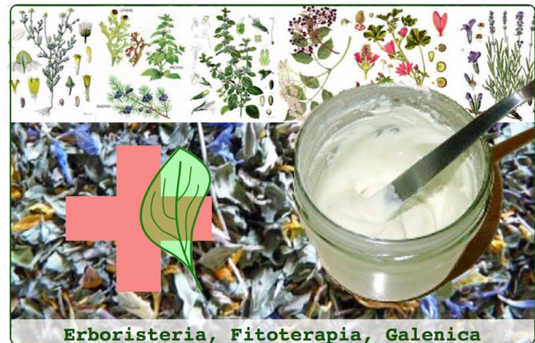
Erboristeria, Fitoterapia, Galenica

Intendiamo di tramandare un pò di questa nobile tradizione in veste moderna. Per questo tutto l'impegno con le seguenti pagine.