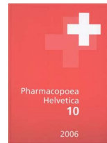
Farmacopea elvetica PhH

Preparati galenici prodotti secondo delle farmacopee nazionali o internazionali si chiamano officinali , mentre prescrizioni individuali composte dal medico e prodotte a regola d'arte dal farmacista in base a una ricetta formale si chiamano magistrali .