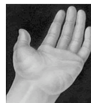
Sindrome del tunnel carpale