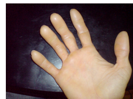
Duroni sulle mani di un rampicatore